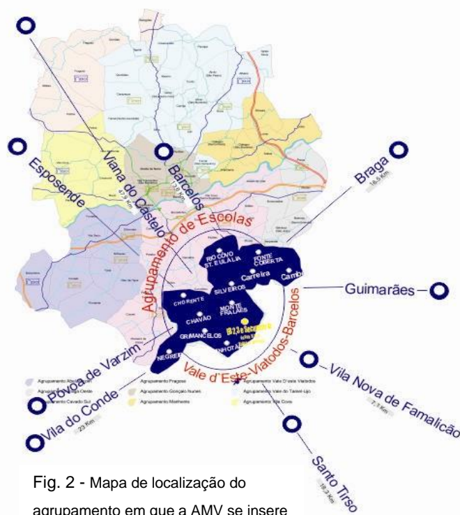
Fig. 2 - Mapa de localização do agrupamento em que a AMV se insere

A Poente - Póvoa de Varzim, a uma distância de 20 km.